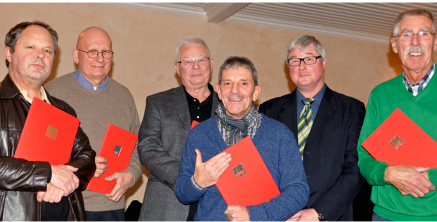
(Abb. 1) Die Jubilare: